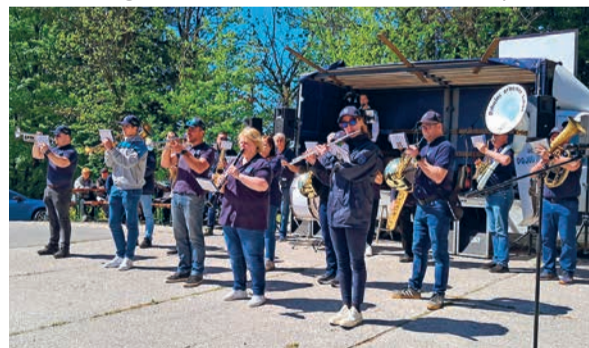
Na prvomajskem srečanju nam je zaigral Pihalni orkester Litija.

Tudi letos je na predvečer prvega maja na Goliščah zagorel kres. Lepo je ogrel številne obiskovalce, saj letos temperature niso bile najbolj prijazne za posedanje na prostem. Je pa toliko bolj bilo sonce radodarno s svojo toploto naslednji dan, ko so se mnogi krajanje KS Jevnice in KS Kresnic tradicionalno srečali pri vodohranu na Goliščah. Pridružili so se jim še številni pohodniki, tudi iz drugih krajev. Nekateri od njih so se pridružili