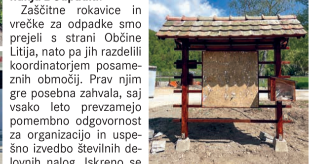
Obnovljeni informativni kozolček z knjigobeznico.

V soboto, 16. aprila 2026, se je na zbornih mestih v Kresnicah in na Kresniškem Vrhu že ob 8. uri zjutraj zbralo več kot 120 prostovoljcev in krajanov. Posebej nas veseli, da se je akcije tudi letos udeležilo veliko otrok in mladih, saj takšna druženja krepijo zavedanje o pomenu varovanja narave ter odgovornega ravnanja z odpadki.