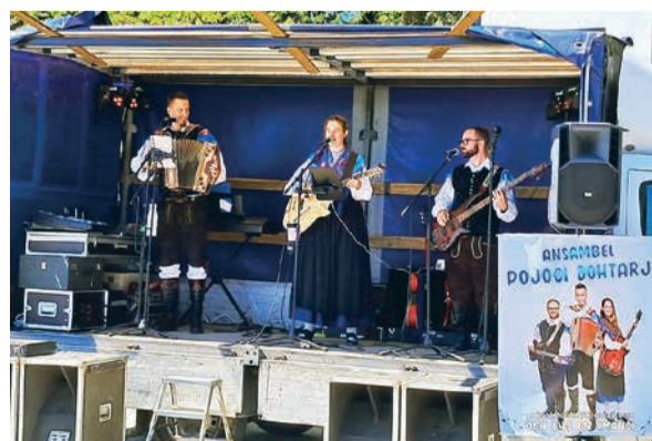
Ansambel Pojčiči dohtarji so s svojo živahno glasbo in dobro voljo poskrbeli za zabavo vseh.

Za veselo in prijetno nadaljevanje druženja je poskrbel ansambel Pojčiči dohtarji, ki so s svojo živahno glasbo in dobro voljo poskrbeli za veselo zabavo vseh.