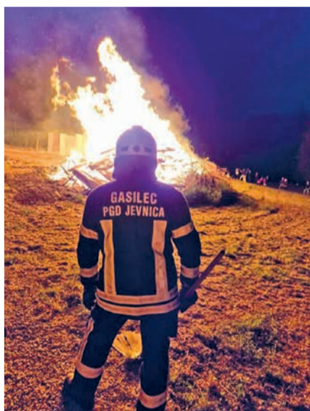
Kres, ki je zagorel na predvečer prvega maja, je lepo ogrel obiskovalce.

Za veselo in prijetno nadaljevanje druženja je poskrbel ansambel Pojčiči dohtarji, ki so s svojo živahno glasbo in dobro voljo poskrbeli za veselo zabavo vseh.