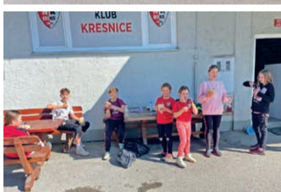
Našim otrokom dajemo vzgled, najbolje tako, da se nam pridružijo tudi pri čistilni akciji.